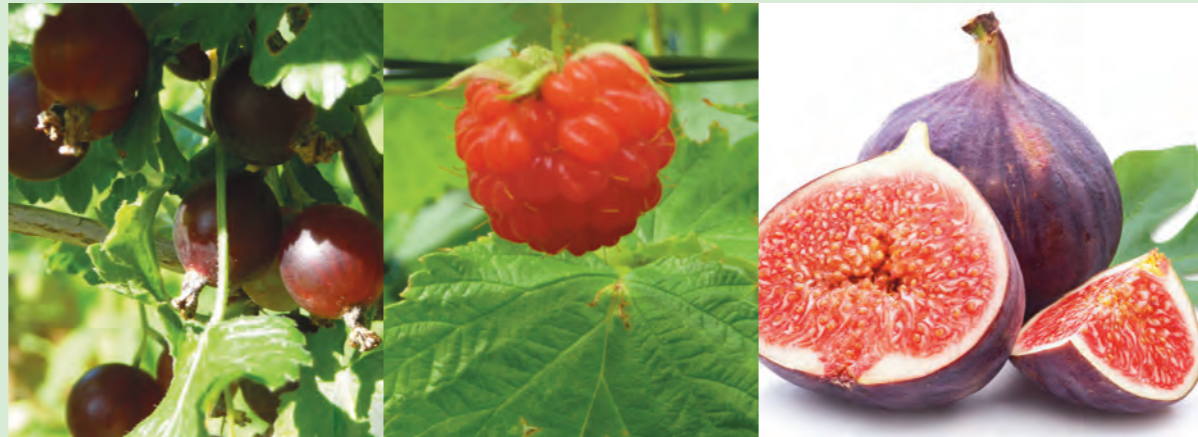
Jostabeere, Himbeere, Feige

Unter den Johannisbeer-Hochstämmen gedeihen Erdbeeren. Diese gehören entgegen ihrem Namen aus botanischer Sicht nicht zu den Beeren, sondern zu den Sammelnussfrüchten. Dies sind die kleinen gelben Nüsschen auf der Oberfläche der Erdbeere.