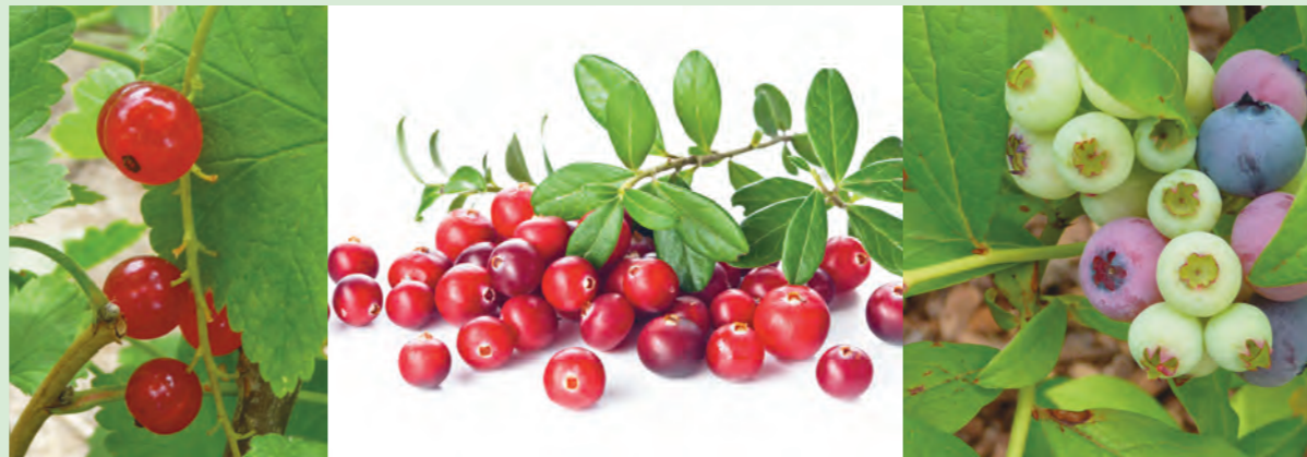
Johannisbeere, Cranberry, Heidelbeere