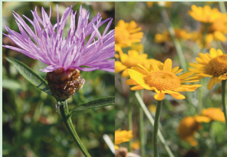
Links: Wiesen-Flockenblume ( Centaurea jacea ) Rechts: Färber-Hundskamille ( Anthemis tinctoria )

Unter dem Titel „Lebendiger Friedhof“ läuft seit Herbst 2013 ein Pilotprojekt im Bereich des Altmarkkreises Salzwedel. Projektpartner sind der Kirchenkreis Salzwedel, der Umweltbeauftragte der EKM, die Hochschule Anhalt und die GARTENakademie Sachsen-Anhalt. Erklärtes Ziel des Projektes ist es, den derzeitigen Pflegeaufwand auf öffentlichen Freiflächen durch den Einsatz speziell zusammengestellter Wildpflanzenmischungen zu minimieren.