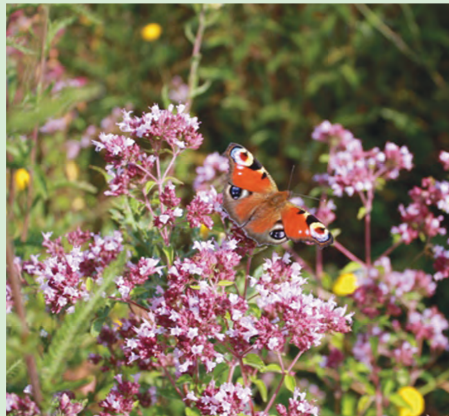
Oregano ( Origanum vulgare ) als Nahrungspflanze für Schmetterlinge

Die in den zwei Saatgutmischungen verwendeten Pflanzenarten zeigen durch ihre Anpasstheit an die in der Altmark typischen sandigen, relativ nährstoffarmen Böden eine hohe Toleranz. Arten wie Grasnelke ( Armeria maritima ) oder Wiesen-Margerite ( Leucanthemum vulgare ) zeichnen sich durch diese Eigenschaften aus, garantieren aber ebenso einen schönen Blühaspekt.