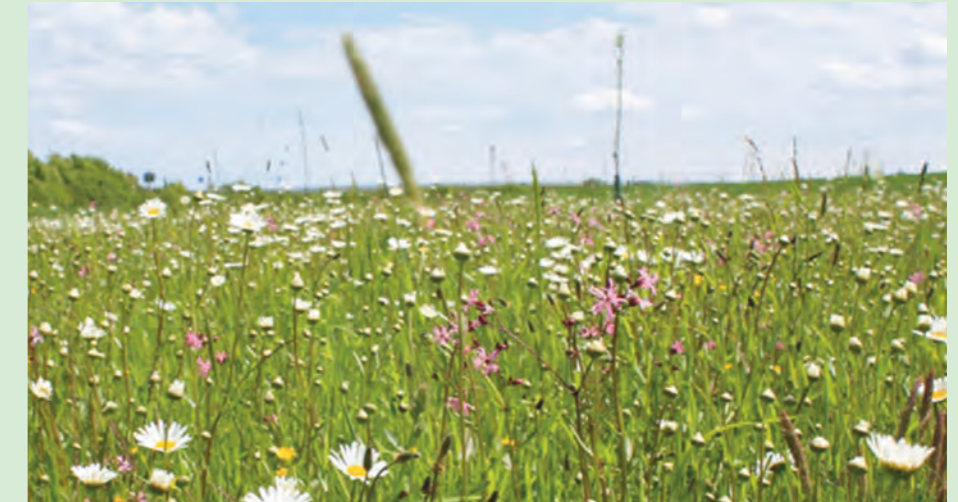
Bunter Blühaspekt im Sommer

Weitere Demonstrationsflächen befinden sich auf den Friedhöfen in Zethlingen, Jeggeleben und Apenburg.